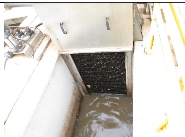
Descrição: Gradeamento no tratamento preliminar.