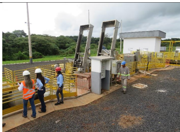
Autor: AMAE Descrição: Tratamento preliminar.