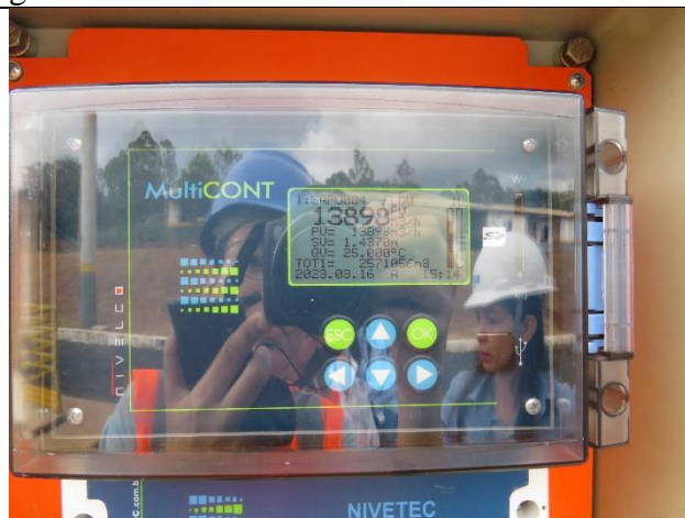
Descrição: Medidor de vazão na calha Parshall.