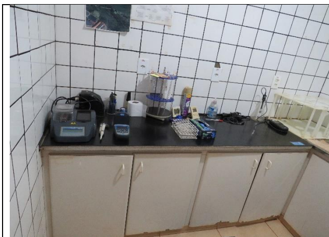
Autor: AMAE Descrição: Laboratório.