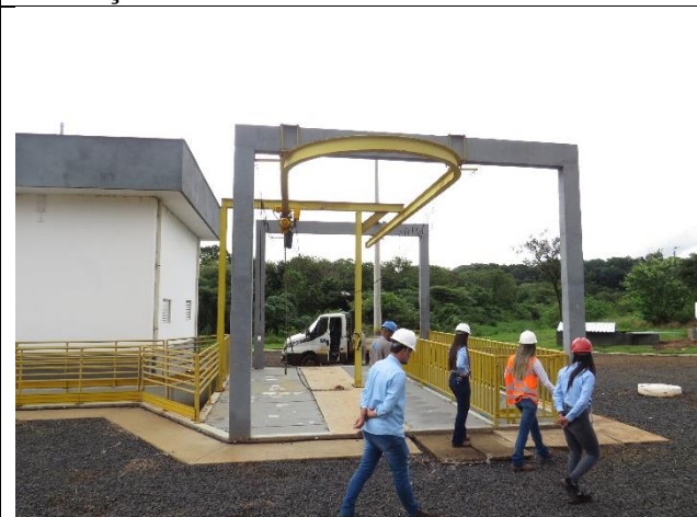
Autor: AMAE Descrição: Estação Elevatória de Esgoto.