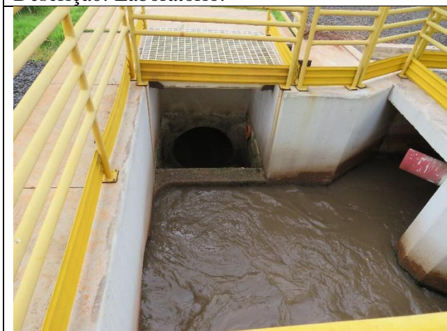
Descrição: Chegada do efluente bruto no tratamento preliminar.