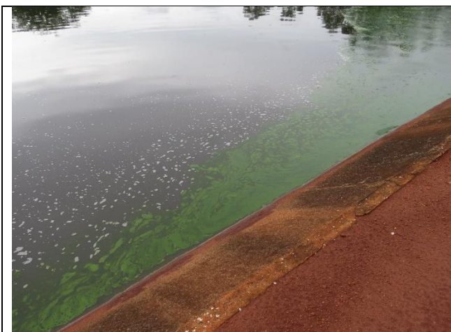
Autor: AMAE Lagoas de maturação – Presença de sobrenadante e manchas verdes.