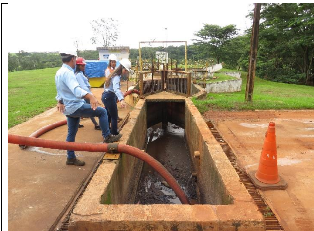
Autor: AMAE Descrição: Ponto de lançamento do caminhão limpa-fossa.