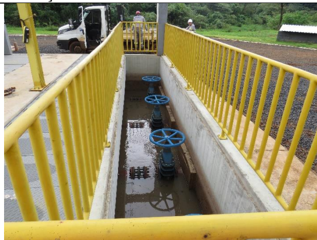
Descrição: Estação Elevatória de Esgoto – Sistema de bombas 2+2.