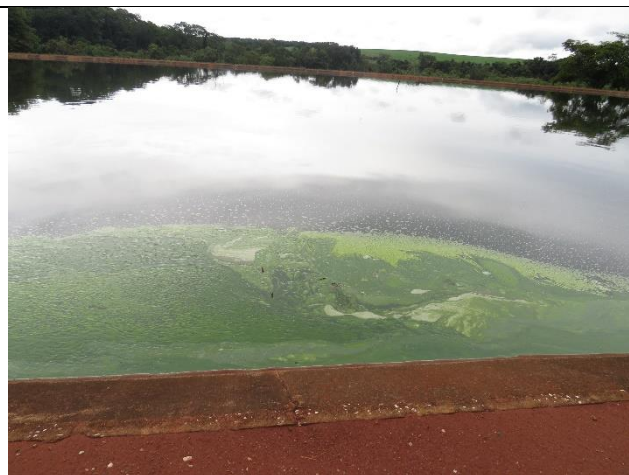
Lagoas facultativas – Presença de sobrenadante e manchas verdes.