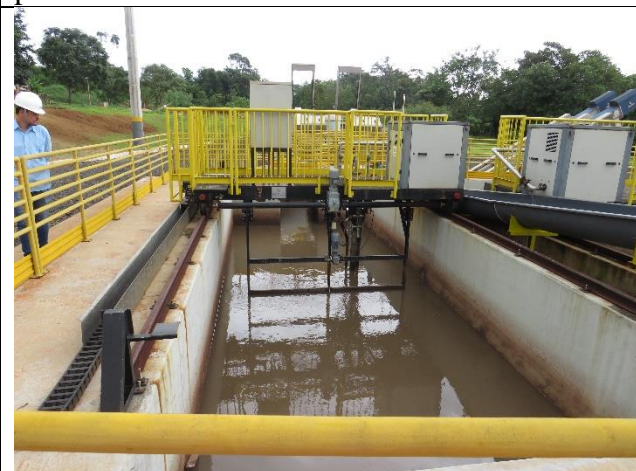
Descrição: Desarenador.