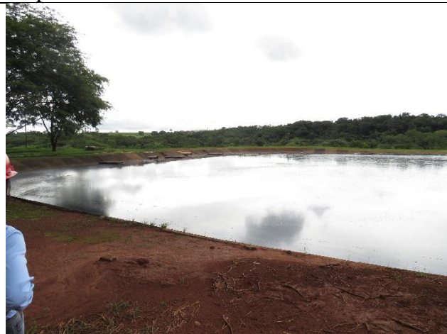
Autor: AMAE Descrição: Presença de zonas mortas nas lagoas anaeróbias.