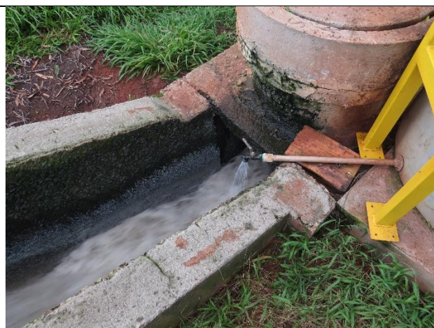
Autor: AMAE Dosagem de antiespumante.