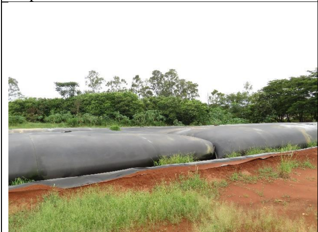
Descrição: Geobags para acondicionamento do lodo.