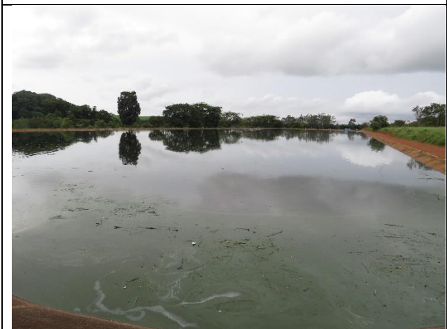
Lagoas facultativas – Presença de sobrenadante e manchas verdes.