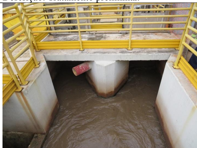
Autor: AMAE Descrição: Distribuição do efluente bruto em dois canais para o tratamento preliminar.