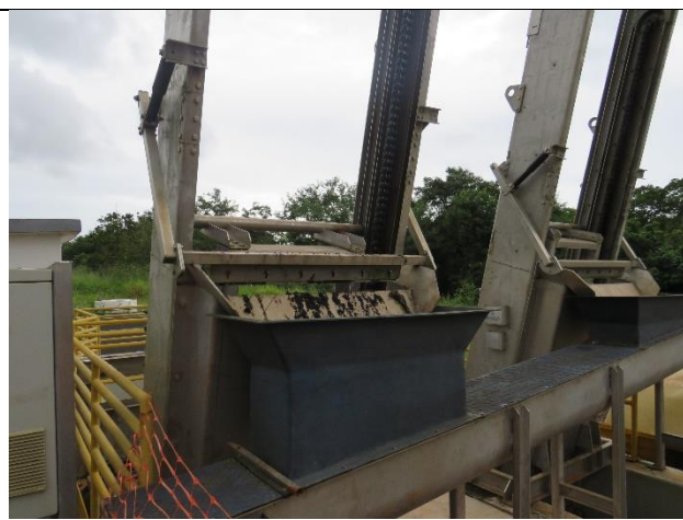
Autor: AMAE Descrição: Limpeza mecanizada do gradeamento.